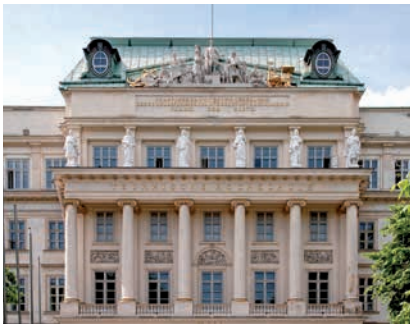
TECHNISCHE UNIVERSITÄT WIEN, HAUPTGEBÄUDE

(2) Abs. 1 ist nicht anzuwenden, wenn die betreffende Person mit einer entsprechenden Kürzung ihres Entgelts einverstanden ist.