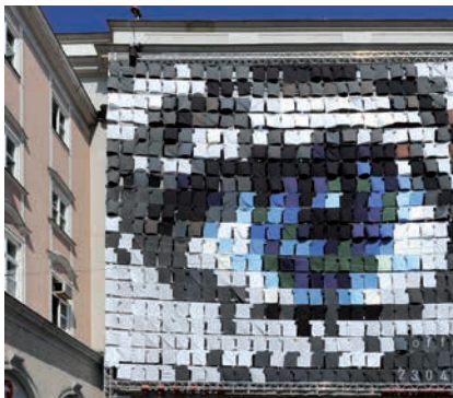
KUNSTUNIVERSITÄT LINZ (EYECATCHER – FASSADEN- GESTALTUNG ZUM TAG DER OFFENEN TÜR 2010)

vertrages bei Lehrveranstaltungen, bei wissenschaftlichen/künstlerischen Arbeiten, bei der Betreuung von Studierenden, bei Verwaltungstätigkeiten und bei der Durchführung von Evaluierungsmaßnahmen sowie an Medizinischen Universitäten oder der Veterinärmedizinischen Universität auch an klinischen Hilfstätigkeiten nach Maßgabe der berufsrechtlichen Vorschriften nach Anweisung ihres/ihrer Dienstvorgesetzten mitzuwirken.