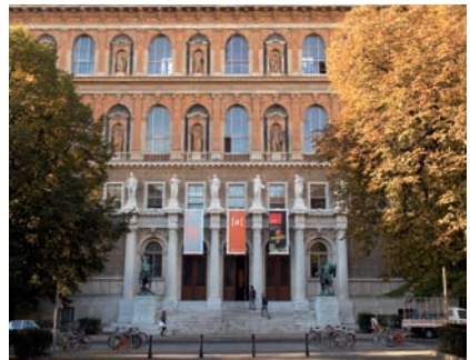
AKADEMIE DER BILDENDEN KÜNSTE WIEN