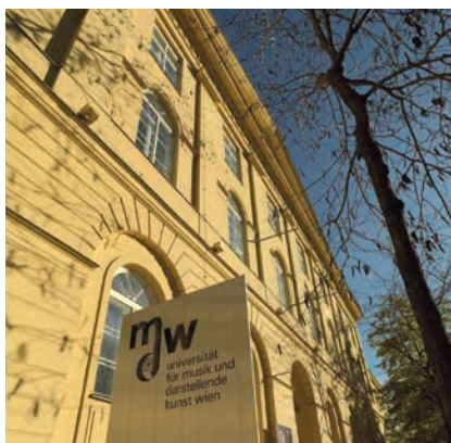
UNIVERSITÄT FÜR MUSIK UND DARSTELLEND KUNST WIEN

(1) Studentische MitarbeiterInnen sind teilzeitbeschäftigte ArbeitnehmerInnen nach § 5 Abs. 2 Z. 1, die bei Abschluss des Arbeitsvertrages ein für die in Betracht kommende Verwendung vorgesehene Master-(Diplom-) Studium noch nicht abgeschlossen haben. Sie haben nach Maßgabe des Arbeits-